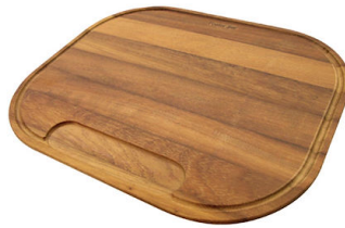
Planche de découpe en bois Iroko