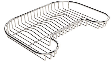
Grille porte-assiettes inox