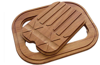
Planche de découpe Twin en bois Iroko