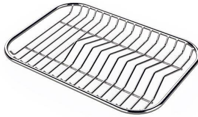
Grille porte-assiettes inox

* uniquement en combinaison avec l'accessoire 8100 112